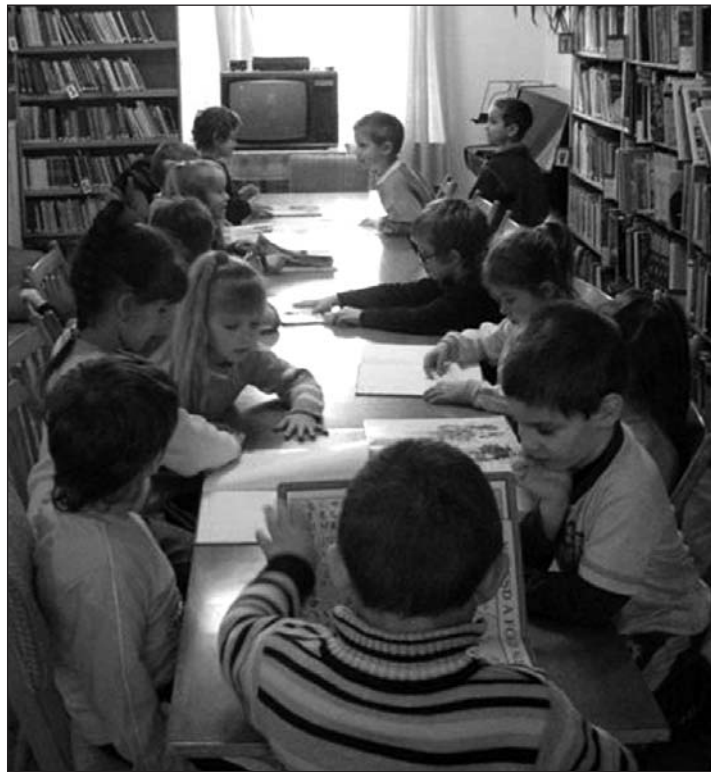
Könyvtári foglalkozáson voltak a nagyközépsős óvodások

Óvodánk 1965 óta fogadja az óvodás gyermekeket. Ma 5 csoporttal működik. Az intézményben 11 óvónő, 5 dajka és az óvodatitkár dolgozik. Az óvodai gyermeklétszám 126 fő. Az étkeztetés helyben történik, az óvoda épületében működő Központi Konyha dolgozói főznek a gyermekeknek és felnőtteknek.