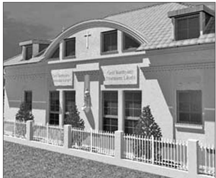
A közösségi ház terve